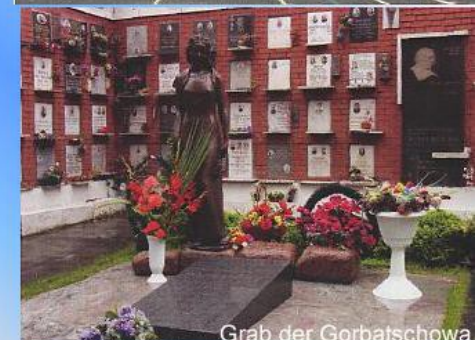
Grab der Gorbatschowa